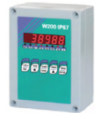
W 200 in IP 67 Ausführung

CE - M Zulassung 10000 Ziffernschritte CE M Zulassung nach EN45501-2009/23/EC-OIML R76:2006