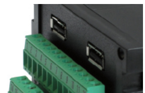
Option: USB Schnittstelle